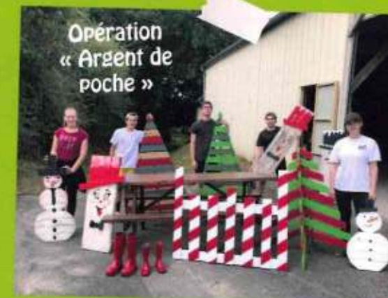
Opération « Argent de poche »