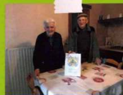
Remise des colis aux aînés