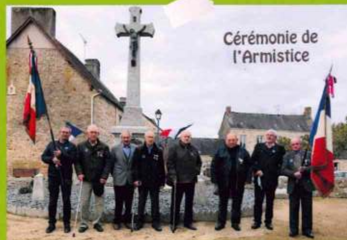
Cérémonie de l'Armistice

L'année 2021 était très bien, bien mieux que 2020 puisque nous avons eu plus de liberté et moins de confinements ! Ce que je retiens le plus, ce sont mes vacances d'été. J'ai aimé voyager avec ma famille et participer à l'opération argent de poche. C'était un plaisir de voir nos créations dans la commune au moment de Noël. Pour cette année, je souhaite obtenir mon BAC puis trouver ma vocation professionnelle. J'aimerais passer mon code pour ensuite avoir mon permis. Et surtout, cette année, je souhaite lâcher le masque ! À St Cyr, il manque des transports en commun pour rejoindre Laval la semaine ainsi que le week-end. J'aimerais aussi participer davantage à des opérations argent de poche avec d'ateliers manuels comme la peinture et pourquoi pas la poterie !