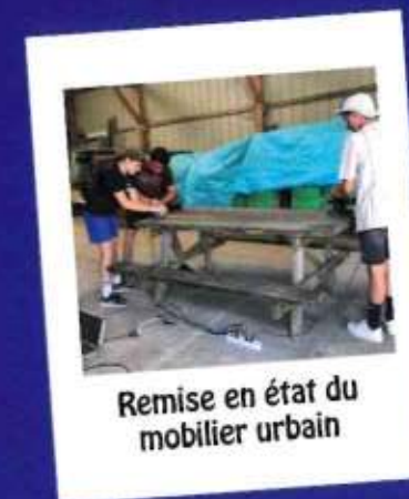
Remise en état du mobilier urbain