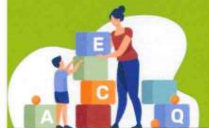
LES ASSISTANTES MATERNELLES