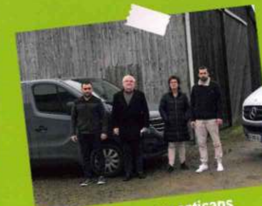
Bienvenue aux artisans