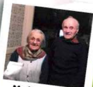
Madame Baslé Retraitée

À titre personnel, moi et ma famille avons emménagé officiellement dans notre maison. À titre professionnel, j'ai acquis un bâtiment industriel pour l'entreprise « Barrais Paysage ». Je ne peux pas faire mieux qu'encrager sur la commune ! Pour 2022, j'espère que la situation sanitaire s'améliorera pour que l'on retrouve une vie dite « normale » afin que l'on puisse profiter de moments avec les amis, famille et même pouvoir discuter avec les personnes que l'on rencontre dans la rue. Que manque-t-il sur St Cyr ? À y réfléchir... avoir un meilleur réseau mais aussi des commerces, une salle des sports mais avec la proximité de Le Pertre, on jouit déjà de cela. Cependant la commune fait beaucoup de choses pour les habitants : il y a aussi un terrain de foot, une salle des fêtes, des chemins pédestres ! Donc au final pour moi ça me va !