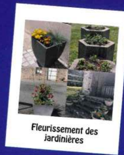
Fleurissement des jardinières