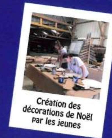
Création des décorations de Noël par les jeunes